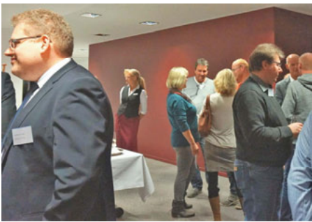
Sponsorenabend vom 9.11.2017