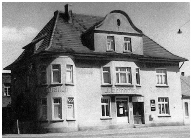
Gaststätte Wilhelm Bernhörster – Gründungs- und Vereinslokal um 1900 (links) und nach Wiederaufbau auf Grund von zerstörerischem Feuer im Jahr 1917