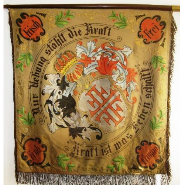
Fahne des Turnverein Friedrichsdorf (Vorder- und Rückseite)

Im 19. Jahrhundert war Friedrichsdorfs sportbegeisterte Jugend nach Isselhorst orientiert. Von dort kam die Anregung, in Friedrichsdorf einen selbstständigen Verein zu gründen.